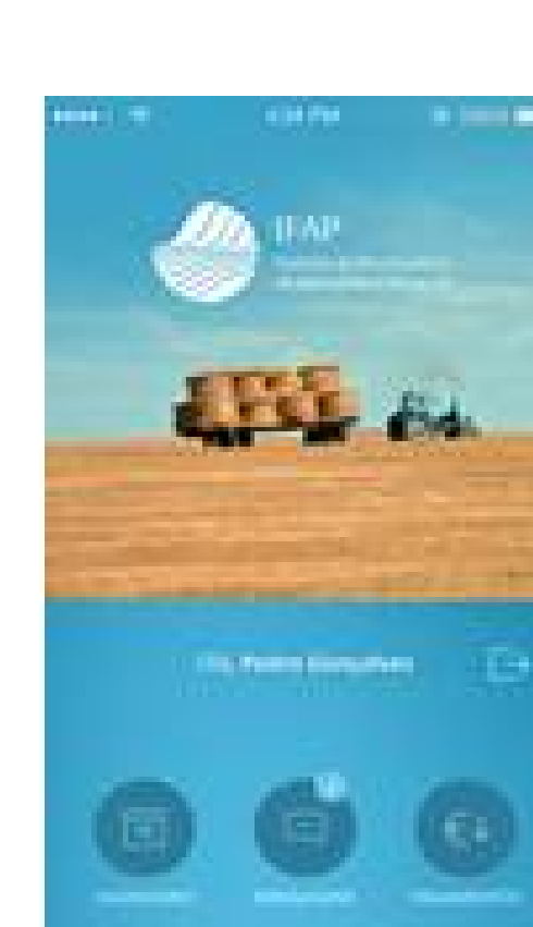
App IFAP Mobile