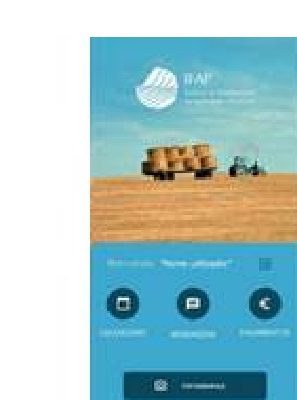
App IFAP Mobile

Consulte outras notícias no Portal do IFAP.