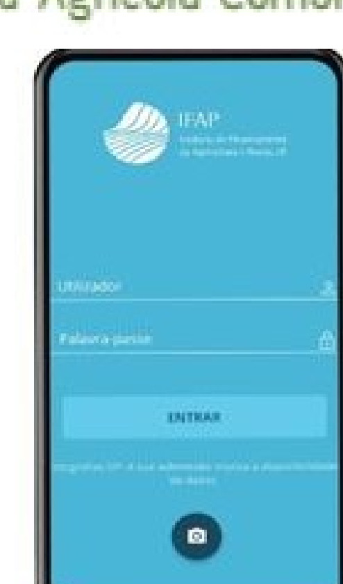
APP IFAP MOBILE