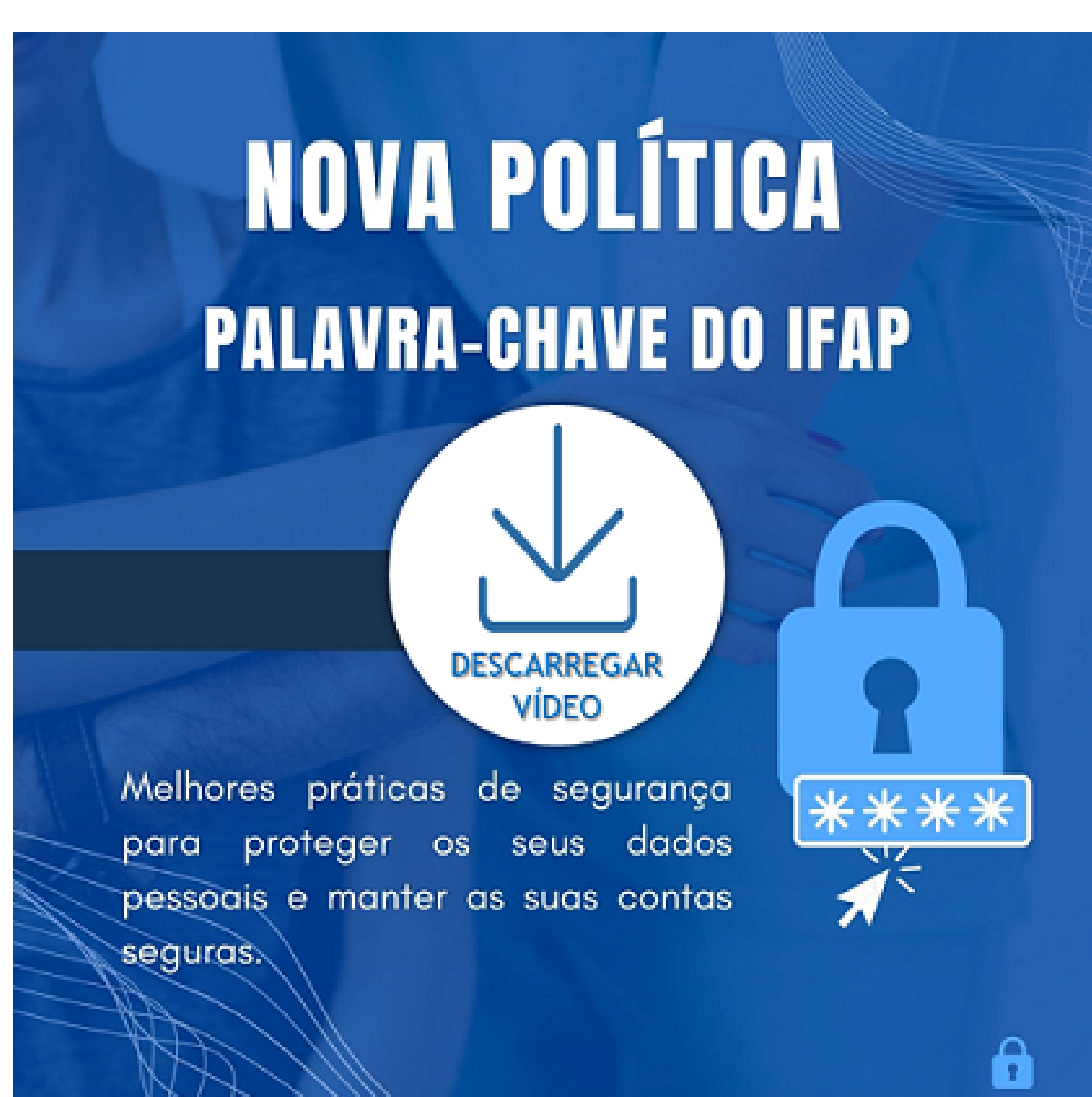
Carregue na imagem para descarregar vídeo explicativo

Recordamos que, após a implementação da nova política de palavras-chave do IFAP , a senha de acesso à Área Reservada e aplicações terá que cumprir os requisitos abaixo: