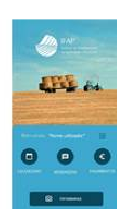
App IFAP Mobile

As candidaturas ao PU2023 podem ser efetuadas diretamente pelo Beneficiário através da Área Reservada do Portal do IFAP, em O Meu Processo » Candidaturas » Pedido Único (PU) » Entregar/Alterar/Consultar , ou recorrendo às Entidades reconhecidas, numa das Salas de Atendimento existentes para o efeito.